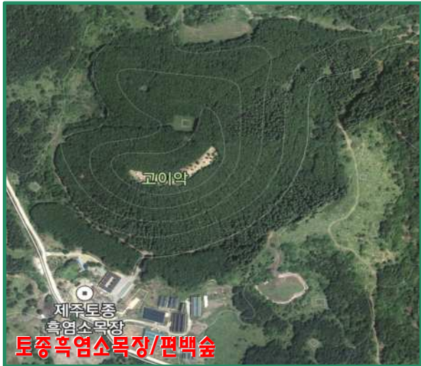
제주토종 흑염소목장 토종흑염소목장/편백숲